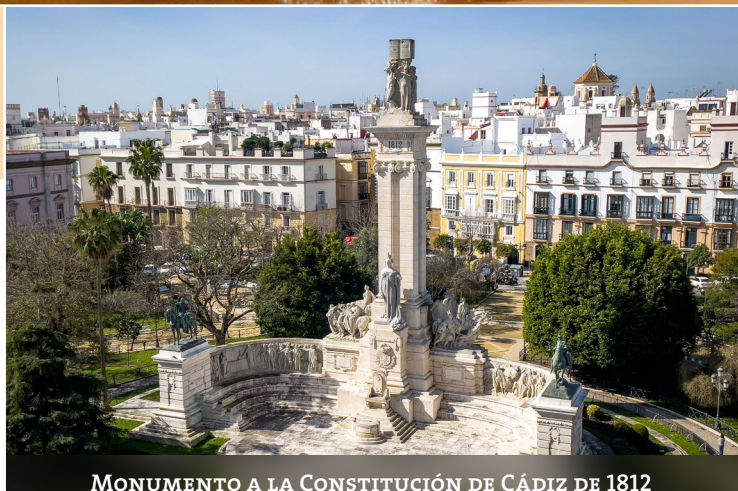
MONUMENTO A LA CONSTITUCIÓN DE CÁDIZ DE 1812

Colegio Oficial de Graduados Sociales Cádiz y Ceuta