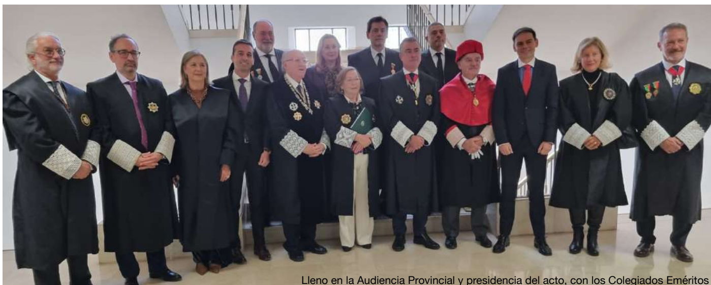
Lleno en la Audiencia Provincial y presidencia del acto, con los Colegiados Eméritos