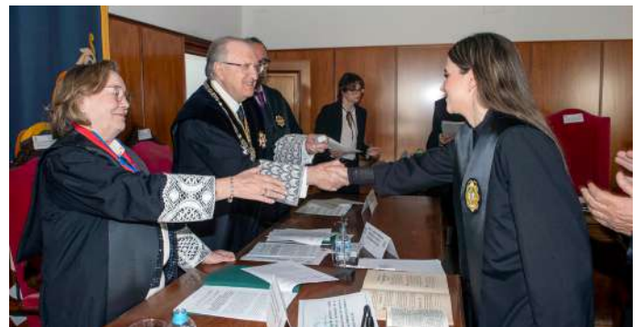
COLEGIADA Nº 1.429