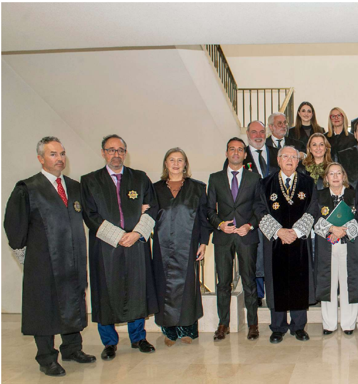
Autoridades, Junta de Gobierno del Colegio y Colegiados Eméritos, en el 'Día del Patrón' 2025