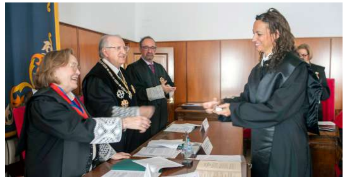
COLEGIADA Nº 1.428