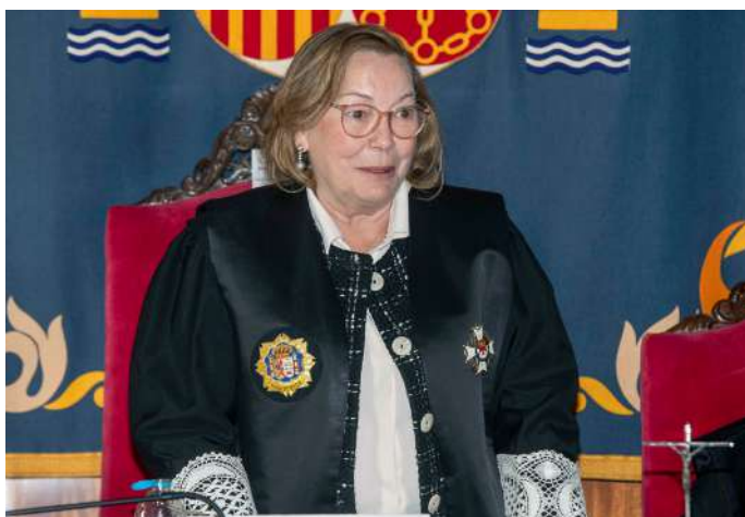
La gran magistrada se jubila este año