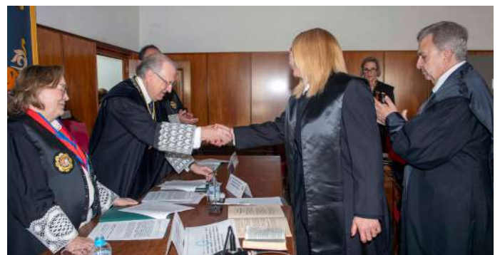
COLEGIADA N° 1.431