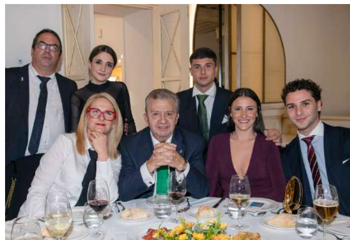
Una de las mesas de colegiados, en el almuerzo de hermandad