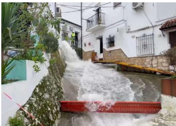
Calles de Ubrique, inundadas