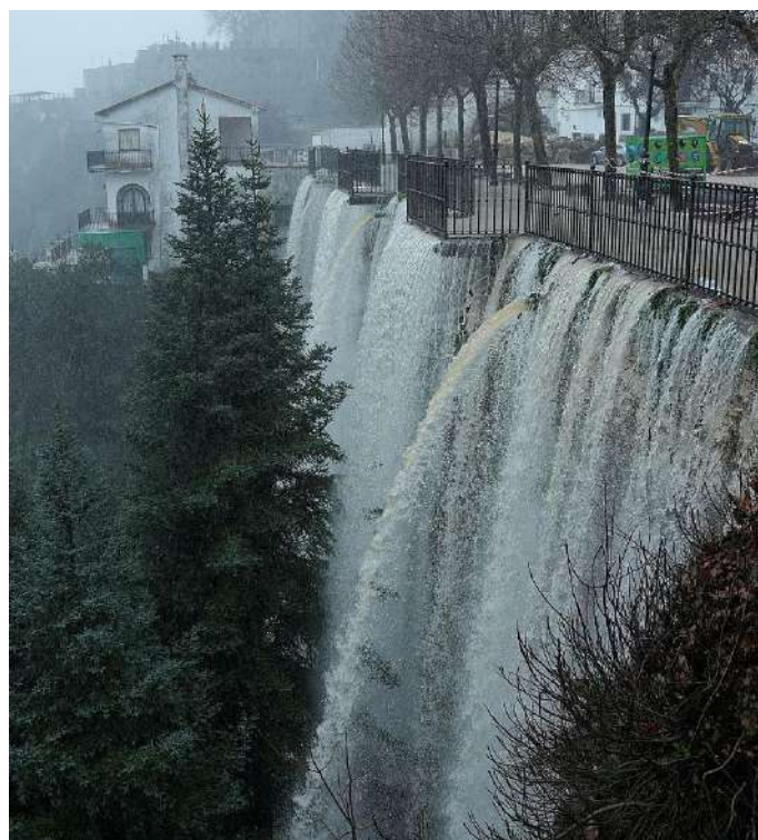
En Grazales cayeron más de 5.000 litros por m2

“ Reclaman también medidas para preservar el tejido productivo mientras persistan las dificultades ”