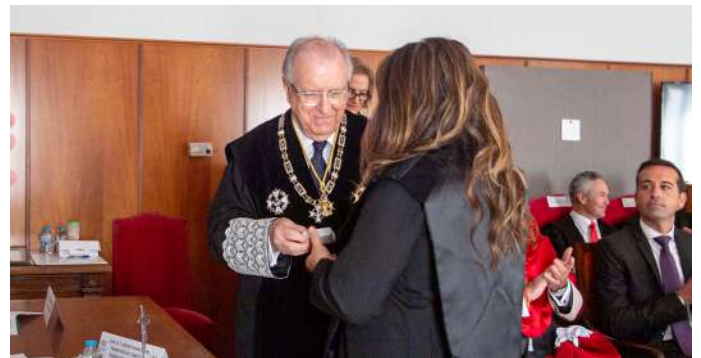
COLEGIADA Nº 1.320