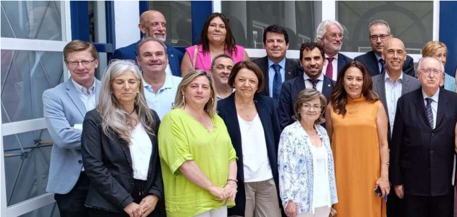
Foto de familia de los asistentes a la reunión, en la Facultad del Ciencias del Trabajo de la Universidad de Córdoba