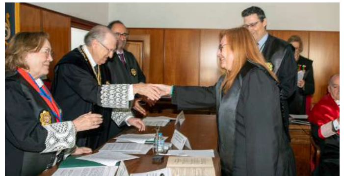
COLEGIADA N1: 1.426