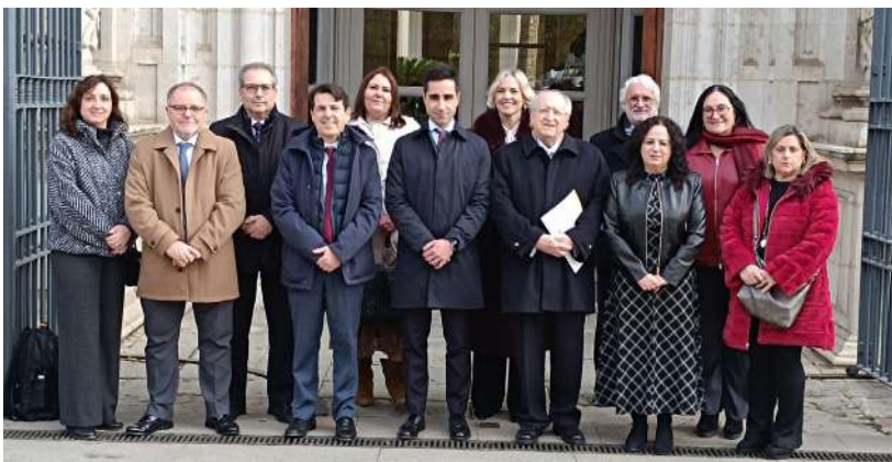
Representación del Consejo Andaluz que se reunió con Juanma Moreno