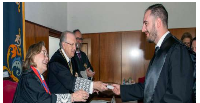
COLEGIADO N° 1.430