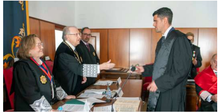
COLEGIADO nº 1.425