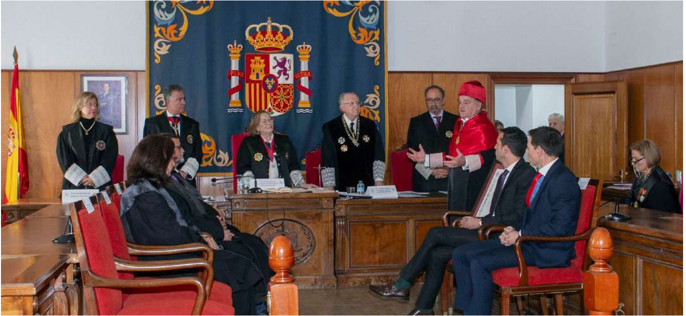
Presidencia del acto institucional celebrado en la Audiencia Provincial