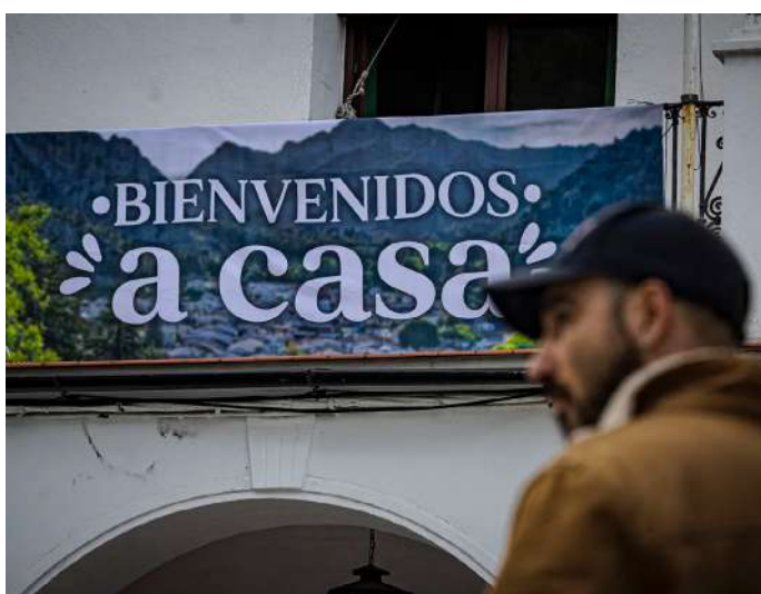
Los vecinos de Grazales pudieron volver a sus casas