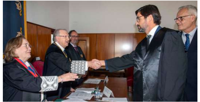
COLEGIADO N° 1.424